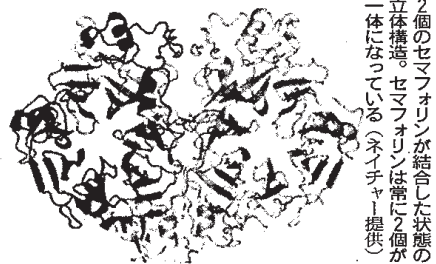
2個のセマフォリンが結合した状態の立体構造。セマフォリンは常に2個が1体になっている